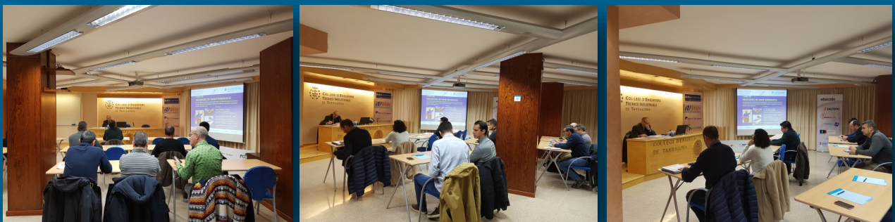
Alumnes assistents al curs a la seu del CETIT a Tarragona

actuen i desenvolupen la seva professió com a Enginyers de Manteniment amb un objectiu clar: controlar el cicle de vida útil de les màquines, instal·lacions i edificis perquè s'allargui el màxim possible, amb el mínim cost possible.