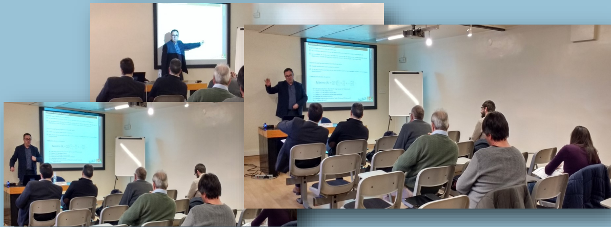
Assistents a la jornada, a les instal·lacions de les Terres de l'Ebre

Es varen exposar les novetats que incorpora el nou reglament APQ desenvolupat en el RD 656/17.