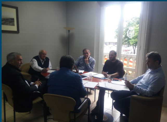
A les fotos: Els degans dels diferents col·legis reunits a la seu d'Enginyers Girona