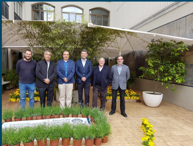
La fotografia s'ha fet a la terrassa del Col·legi on hi ha la instal·lació de Girona Temps de Flors

El passat 15 de maig el Col·legi de Girona va acollir la trobada del Consell de Col·legis d'Enginyers Tècnics Industrials de Catalunya.