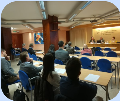
Assistents a la JGO de desembre al CETIT, Tarragona

El passat mes de desembre es va celebrar la Junta General Ordinària del CETIT a la seu de Tarragona i va ser transmesa per videoconferència a les instal·lacions de les Terres de l'Ebre, a Tortosa.