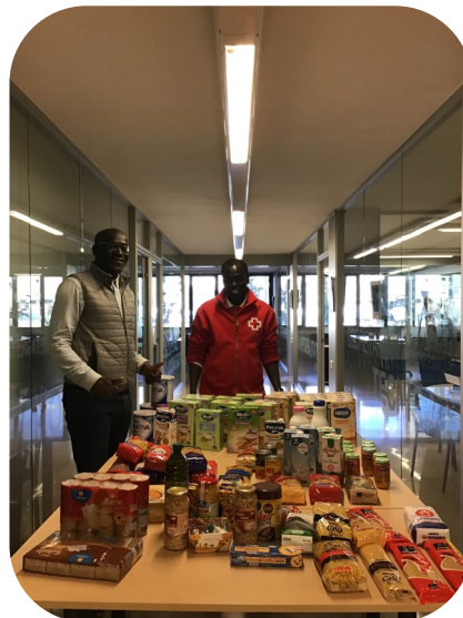
Voluntaris de la Creu Roja de Tarragona a la seu del CETIT, a Tarragona en el moment de la recollida d'aliments

Un any més, i ja en van sis, volem donar les gràcies a tots els col·legiats i col·legiades que han participat i col·laborat en la recollida d'aliments.