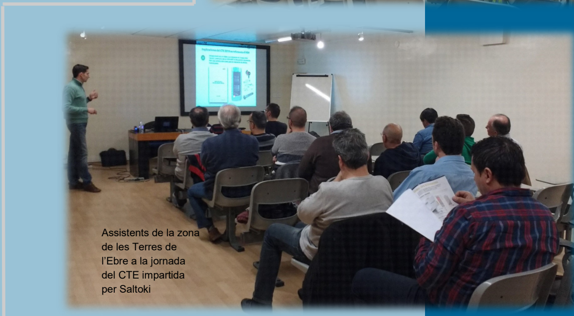
Assistents de la zona de les Terres de l'Ebre a la jornada del CTE impartida per Saltoki