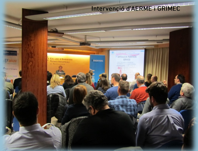
Intervenció d'AERME i GRIMEC

El nou RIPCI s'estructura en dos parts. La primera comprèn el reglament pròpiament dit i, la segona, els tres annexos que contenen les disposicions tècniques. El primer annex estableix les exigències relatives al disseny i instal·lació dels equips i sistemes de protecció contra incendis; el segon, el manteniment mínim dels mateixos i, el tercer, els mitjans humans mínims amb que han de dir les empreses instal·ladores i mantenidores.