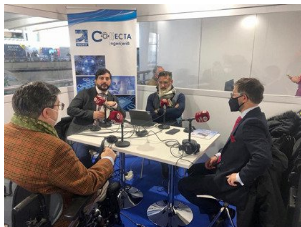
Emisión del programa dedicado al desarrollo del talento y al portal ProEmpleoIngenieros del COGITI, el pasado 17 de noviembre.

Durante el programa se puso de manifiesto la importancia de que los ingenieros estén constantemente formados en el desarrollo de sus trayectorias profesionales, con una formación de calidad y adaptada a las necesidades del mercado laboral, especialmente en el ámbito de las nuevas tecnologías.