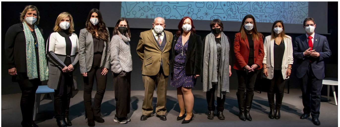
Foto de familia del Acto inaugural de la Exposición mujeres ingenieras en Valencia